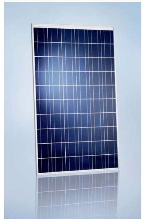
SCHOTT POLY™ 217/220/225/230